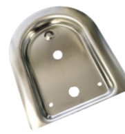
ツバ無 大型用、中型用