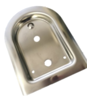
ツバ付 大型用、中型用